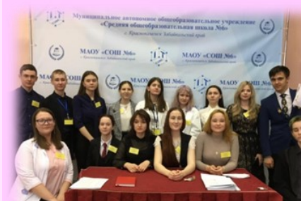
Организаторы и эксперты квест-игры «Горизонты открытий».